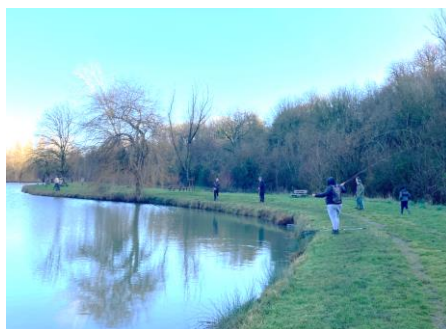
C'est parti !